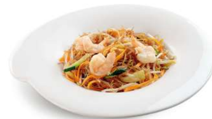
94 SPAGHETTI DI SOIA CON GAMBERI spaghetti di soia con gamberi*, verdure e uova € 6,00