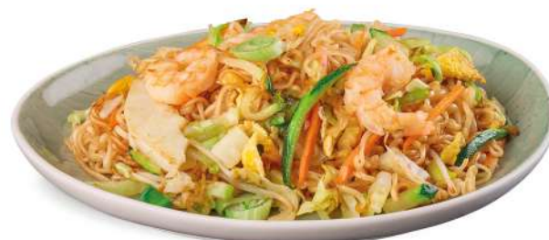
87 NOODLES KAISEN noodles saltati con misto mare*, verdure e uova