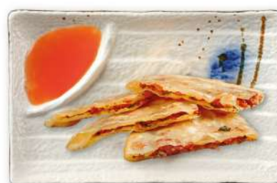
37 ERBAZZONE CINESE ripieno di salsiccia e crauti