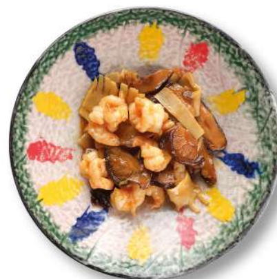
307 GAMBERI CON BAMBÙ E FUNGHI gamberi* con bambù e funghi