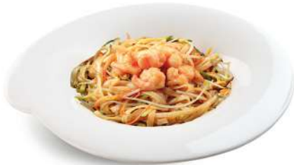
96 TAGLIATELLE DI RISO CON VERDURE E GAMBERI tagliatelle di riso con verdure, gamberi* e uova € 6,00