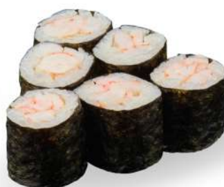
197 EBI MAKI gamberi*