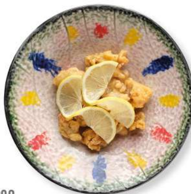
290 MAIALE AL LIMONE maiale in pastella fritto con salsa al limone