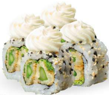
234 ASPARAGO MAKI tempura di asparagi*, philadelphia, insalata e sesamo