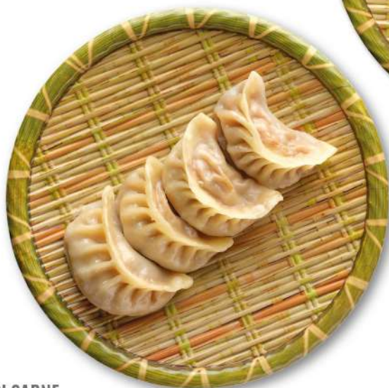
40 RAVIOLI DI CARNE ravioli con ripieno di carne e verdure