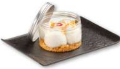
MANGO TANGO Semifreddo al mascarpone con crumble di biscotti e salsa al mango. € 5.00