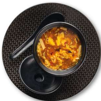
70 ZUPPA AGROPICCANTE tofu, bambù, pollo*, uova, carote, orecchie di giuda, fecola di patate