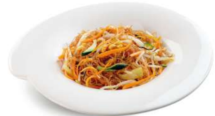
95 SPAGHETTI DI SOIA CON VERDURE spaghetti di soia con verdure miste e uova € 5,00