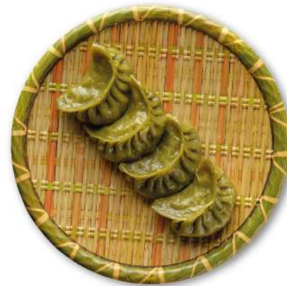
44 RAVIOLI DI VERDURE ravioli con ripieno di verdure