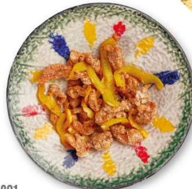
291 MAIALE SALE E PEPE maiale saltato sale e pepe