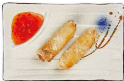
23 INVOLTINI VIETNAMITI Pollo, noodles, cipolle, carote, salsa di pesce