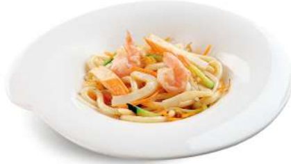
88 YAKI UDON spaghetti giapponesi con misto mare*, uova e verdure € 7,00