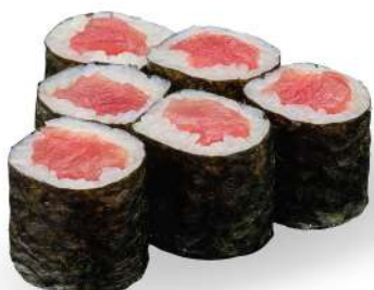
190 TEKKA MAKI tonno*