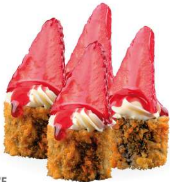
175 FRAGOLAMAKI (4pz) salmone*, philadelphia, fragola e topping alla fragola € 4,00