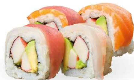
231 RAINBOW surimi*, avocado, pesce misto* crudo € 5,00