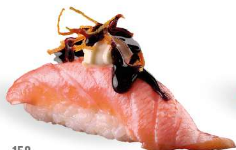
158 SHAKE FIRE salmone* scottato, salsa teriyaki, philadelphia, carote