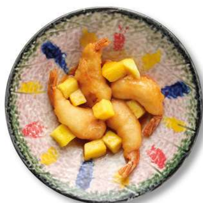
304 GAMBERI IN AGRODOLCE gamberi* in pastella con salsa agrodolce, ananas