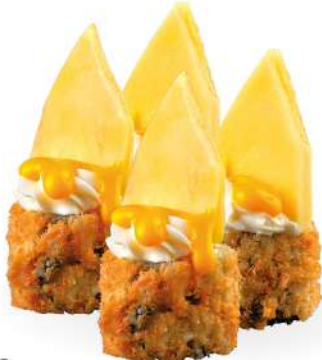
176 MANGOMAKI (4pz) salmone*, philadelphia, mango e salsa al mango € 4,00