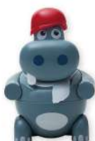
HIP HOP Fragola € 5,00