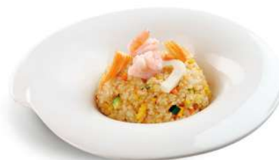
85 YAKI MESHİ riso con gamberi*, uova e verdure