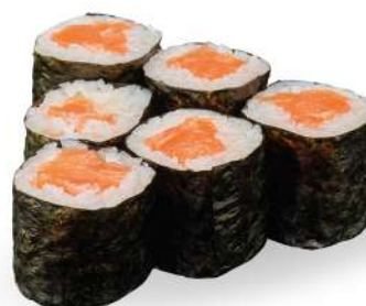
194 SAKE MAKI salmone*