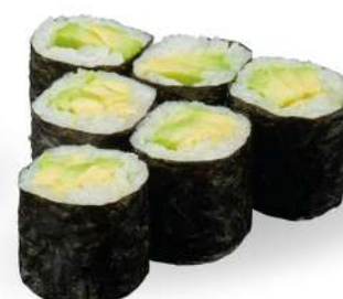
198 AVO MAKI avocado