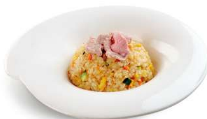
84 TENSHINHAN riso con manzo, uova e verdure