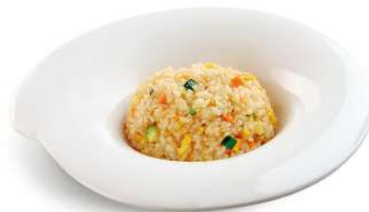
82 YASAI MESHİ riso con uova e verdure