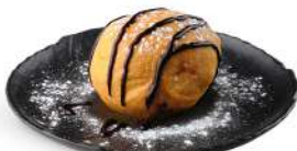
GELATO FRITTO Gelato fritto € 4.50