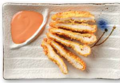
27 POLLO FRITTO pollo* fritto