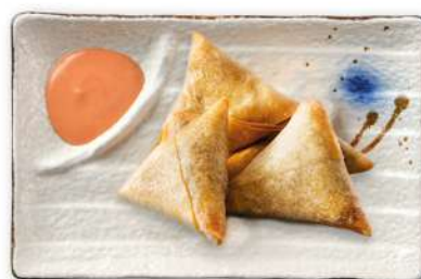
36 SAMOSA DI GAMBERI crocchette triangoli di gamberi* fritte