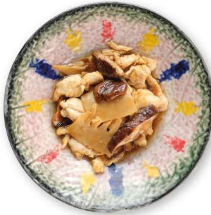
288 POLLO CON BAMBÙ E FUNGHI pollo* con bambù e funghi € 6,00