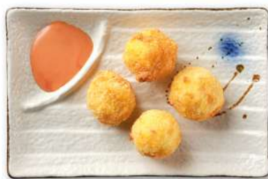
34 POLPETTE DI GAMBERI polpette di patate ripiene di gamberi*