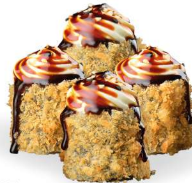
177 HOSO FRITTO (4pz) salmone*, philadelphia, sesamo € 4,00