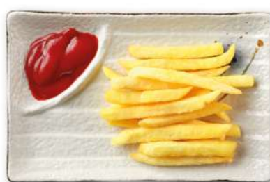
24 PATATINE FRITTE*