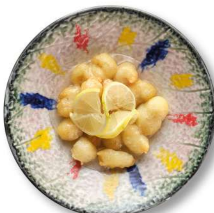
285 POLLO AL LIMONE pollo* in pastella con salsa al limone € 6,00