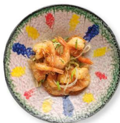
306 GAMBERETTI SALE E PEPE gamberi* saltati sale e pepe