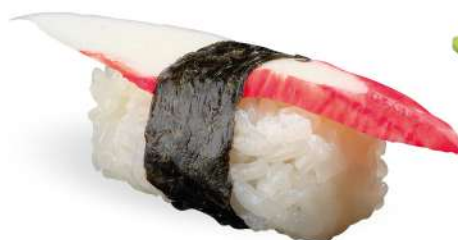
162 KANI surimi*