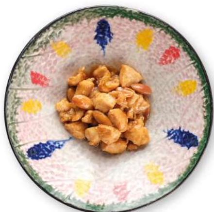
287 POLLO ALLE MANDORLE pollo* con mandorle € 6,00