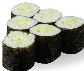
192 KAPPA MAKI cetrioli