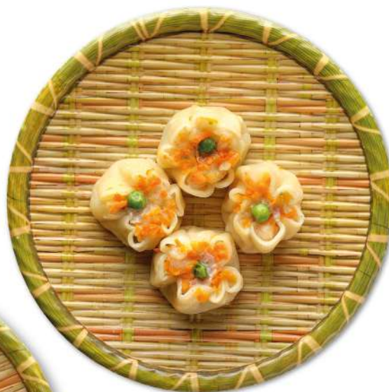
41 SHAO MAI ravioli con ripieno di carne e gamberi* (presenza di carne)