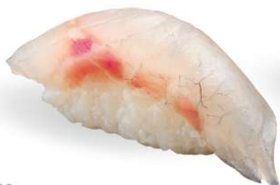
169 SUZUKI branzino*