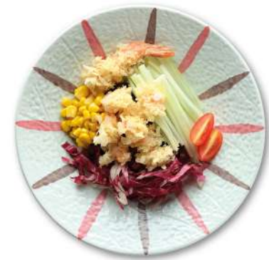
114 EBI POKE gambero* in tempura, radicchio rosso, cetrioli, mais, salsa teriyaki, riso € 10,00