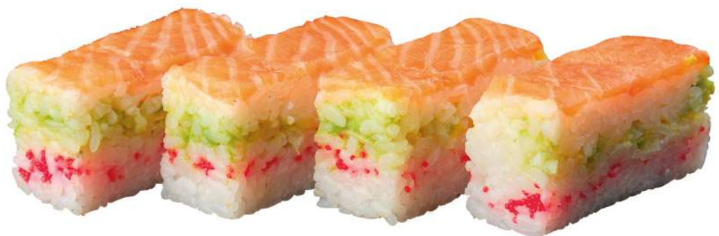
247 KAYI SANDWICH MAKI salmone*, tonno*, avocado, tobikko*