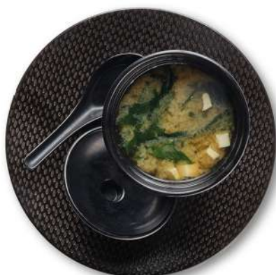
73 ZUPPA DI MISO miso, alghe, tofu