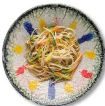
76 GERMOGLI DI SOIA E VERDURE germogli di soia e verdure di stagione saltati al wok