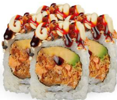
214 SAKE COTTO PLUS salmone* cotto, avocado, maionese, salsa teriyaki, sesamo, cipolla frita