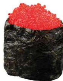
142 TOBIKKO uova* di pesce volante e riso