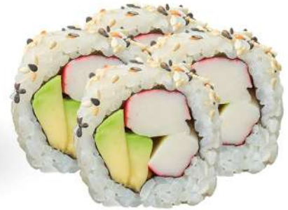
230 CALIFORNIA surimi*, avocado, sesamo