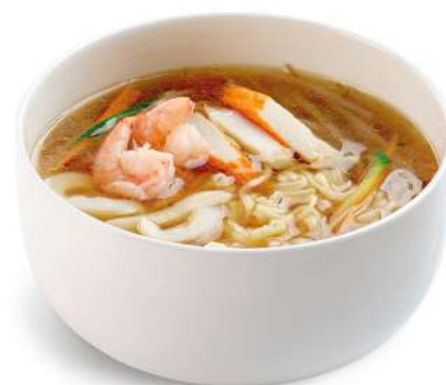
62 RAMEN CON PESCE spaghetti in brodo con misto mare* e verdure € 8,00