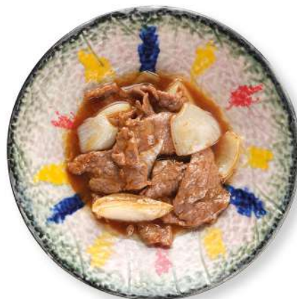
281 MANZO CON CIPOLLA manzo con cipolla € 8,00