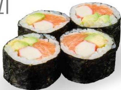
185 FUTOMAKI salmone*, avocado, surimi* € 5,00