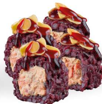
212 BLACK SALMON MANDORLA salmone* cotto, riso venere, mandorle, salsa teriyaki, philadelphia