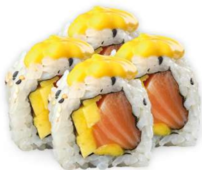
222 SALMON MANGO salmone*, mango, salsa al mango e philadelphia € 5,00