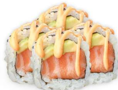
221 SPICY SALMON salmone*, avocado, salsa piccante, spicy maio € 5,00