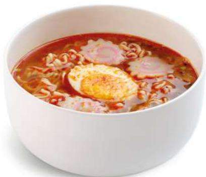
60 RAMEN PICCANTE spaghetti in brodo piccante con naruto* e uovo sodo € 7,00