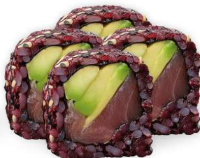
225 BLACK TUNA riso venere, tonno*, avocado € 5,00