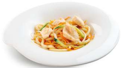
90 TORI UDON spaghetti giapponesi con pollo*, uova e verdure € 7,00