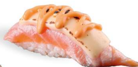
160 SHAKE CHEESE FIRE salmone* scottato, formaggio, spicy maio