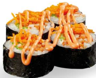
186 FUTOTORI pollo*, insalata, spicy maio, cartote fritte € 5,00