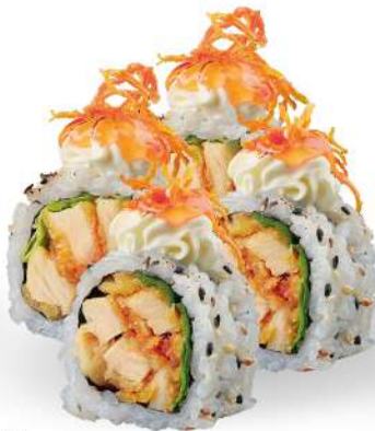
245 TORI PHILLY pollo*, insalata, philadelphia, salsa sweet chilly, carote fritte, sesamo