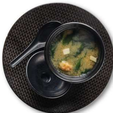
71 ZUPPA DI MISO CON WENDUM miso, wendum