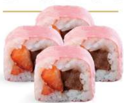
SUSHI CHOCO STRAWBERRY (4pz) Sushi ripieno di nutella® e fragole € 5.00