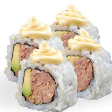
223 TUNA COTTO tonno cotto, avocado, maionese € 5,00