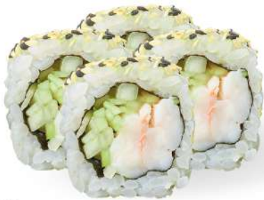
228 EBI URAMAKI gamberi cotti*, cetrioli, sesamo