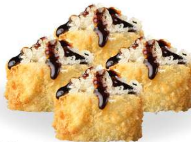
179 URAMAKI FRITTO (4pz) avocado, surimi*, salmone*, salsa teriyaki, briciole di tempura € 5,00