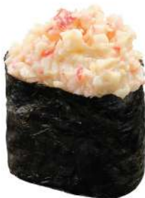
141 CALIFORNIA granchio*, maionese, riso