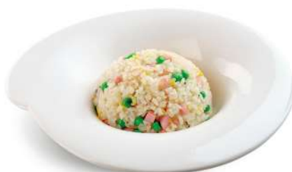
81 RISO CANTONESE riso con uova, piselli* e prosciutto cotto