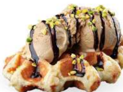
WAFFLE Waffle* con gelato € 5.00