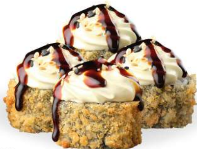
178 FUTOMAKI FRITTO (4pz) salmone*, avocado, surimi*, philadelphia, salsa teriyaki, sesamo € 5,00