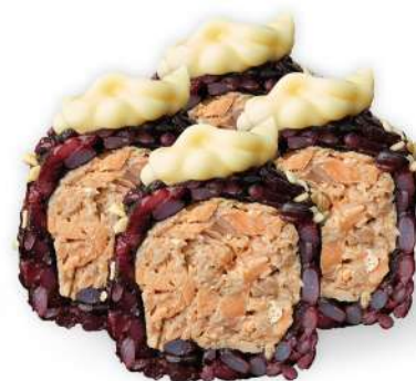
215 BLACK SAKE COTTO riso venere, salmone* cotto, maionese, sesamo