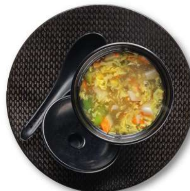
72 ZUPPA DI ASPARAGI asparagi*, granchio*, uovo, fecola di patate