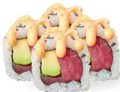
224 SPICY TUNA tonno*, avocado, salsa piccante, spicy maio € 5,00