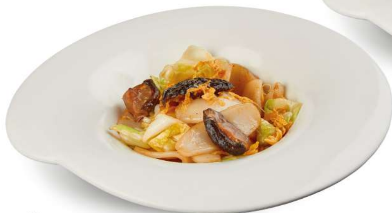
65 GNOCCHI DI RISO CON VERDURE gnocchi di riso con cavolo cappuccio, funghi shiitake, uova