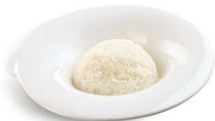
80 RISO BIANCO riso bianco