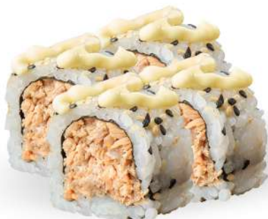
213 SAKE COTTO salmone* cotto, maionese, sesamo