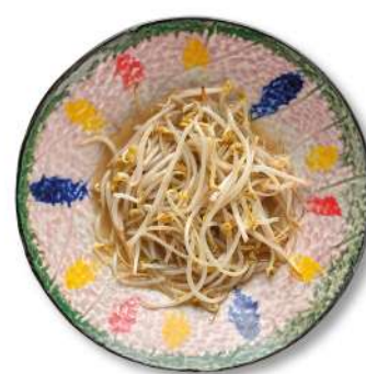
78 GERMOGLI DI SOIA AL WOK germogli di soia saltati al wok