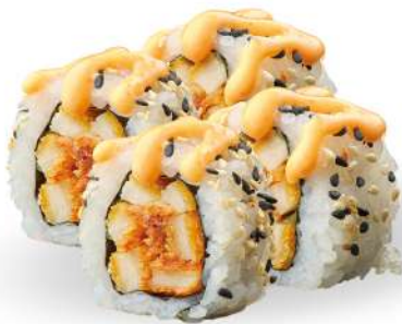
244 TORI MAKI tempura di pollo*, salsa piccante, insalata, sesamo, spicy maio