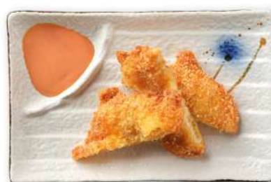
35 PESCE FRITTO pesce fritto*