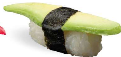
167 AVOCADO avocado