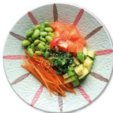
113 KAYI POKE salmone*, alghe, fagioli, avocado, sesamo, riso, salsa di sesamo € 10,00