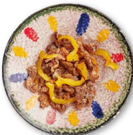
284 MANZO SALE E PEPE manzo saltato sale e pepe € 8,00