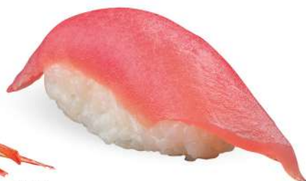
164 MAGURO tonno*