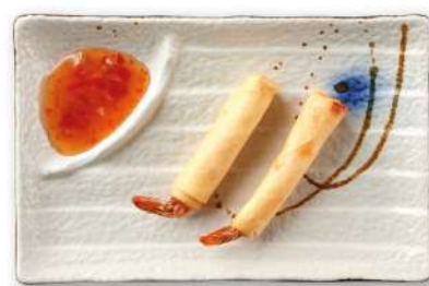
22 INVOLTINI DI GAMBERI involtini ripieno di gamberi*