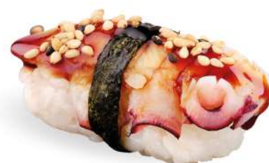
166 TAKO polpo* cotto e sesamo