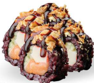
216 BLACK CALIFORNIA PLUS riso venere, surimi*, cetriolo, salmone*, sesamo, cipolla frita, maionese, salsa teriyaki