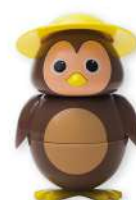
CIP Cioccolata € 5,00