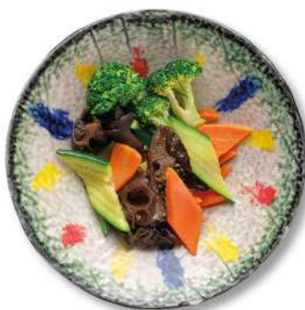
77 VERDURE AL WOK DI STAGIONE verdure miste di stagione saltate al wok