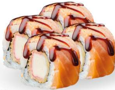
229 KAYI MAKI tempura di surimi*, salmone* scottato