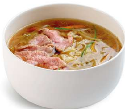
61 RAMEN CON MANZO spaghetti in brodo con manzo e verdure € 8,00