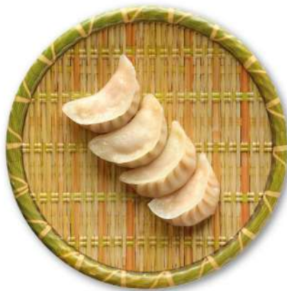
43 RAVIOLI TRASPARENTI ravioli con ripieno di gamberi* (presenza di carne)