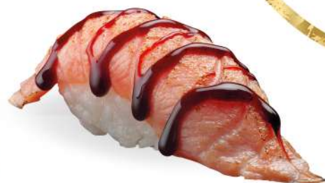
171 SAKE KAYI salmone* scottato e salsa teriyaki