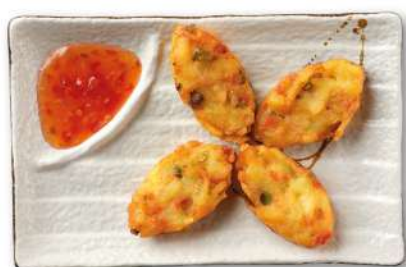
26 CROCCHETTI DI VERDURE crocchette di patate con ripieno di verdure