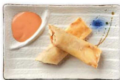
21 INVOLTINI DI SALMONE involtini di salmone* fritti