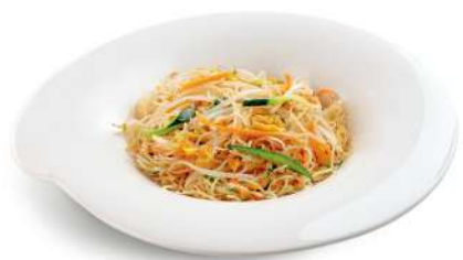
93 SPAGHETTI DI RISO CON VERDURE spaghetti di riso con verdure e uova € 5,00