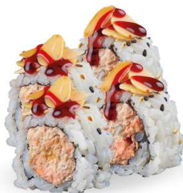
248 SAKE COTTO MANDORLE salmone* cotto, scaglie di mandorle, salsa teriyaki € 5,00