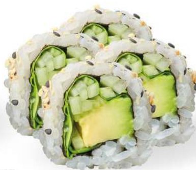
235 VEGGY MAKI avocado, insalata