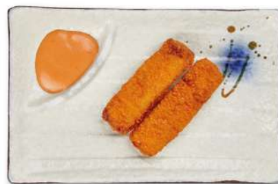
32 BASTONCINI DI MERLUZZO bastoncini di merluzzo* fritti