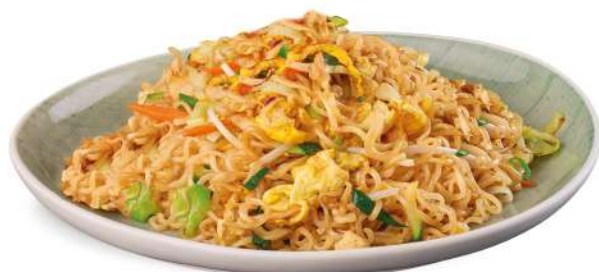
86 NOODLES YASAI noodles saltati con carote, zucchine, germogli di soia, uova