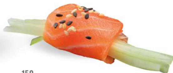
150 DUTOU SAKE E VERDURE cetrioli, philadelphia, salmone* e sesamo