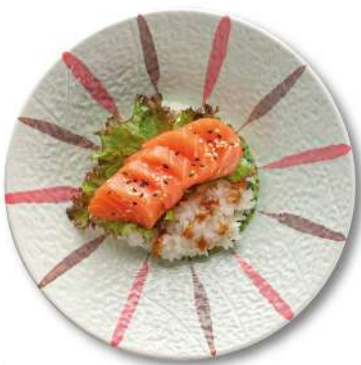
110 CHIRASHI SAKE DON riso ricoperto da salmone*, salsa di sesamo € 8,00