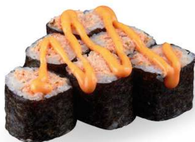
196 MIURA SPICY salmone* cotto, salsa spicy