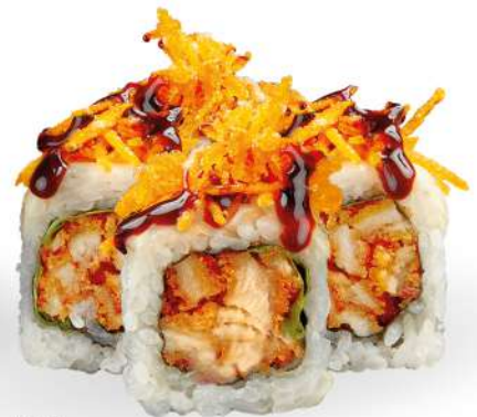
246 TORI CHEESE FIRE pollo fritto, insalata, formaggio scottato, carote fritte, salsa sweet chilly, sesamo