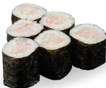
193 SUZUKI MAKI branzino*