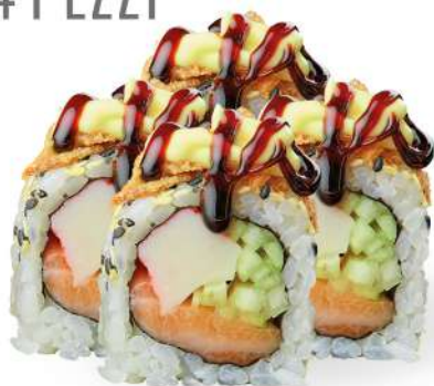
219 CALIFORNIA PLUS surimi*, cetriolo, salmone*, sesamo, cipolla frita, maionese, salsa teriyaki € 5,00