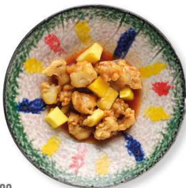
289 MAIALE IN AGRODOLCE maiale in pastella fritto, salsa agrodolce