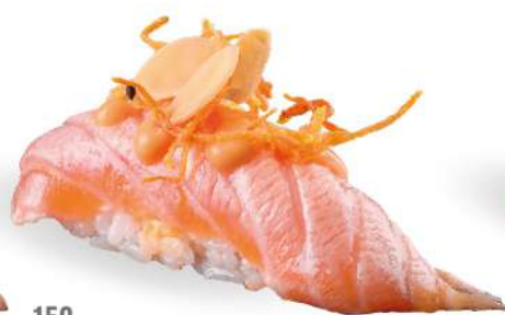
159 SHAKE FLAMBÈ SPICY salmone* scottato, salsa spicy maio, mandorle croccanti, carote