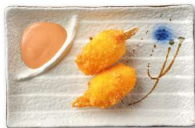
33 CHELE DI GRANCHIO chele di granchio* fritte