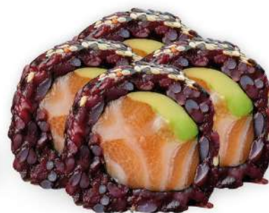
217 BLACK SALMON riso venere, salmone*, avocado