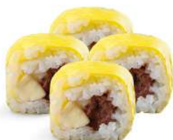
SUSHI CHOCO BANANA (4pz) Sushi ripieno di nutella® e banane € 5.00