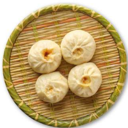
42 XIAO LONG BAO ravioli con ripieno di carne e funghi shiitake