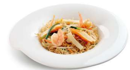
92 SPAGHETTI DI RISO CON MISTO MARE spaghetti di riso con misto mare*, verdure e uova € 6,00