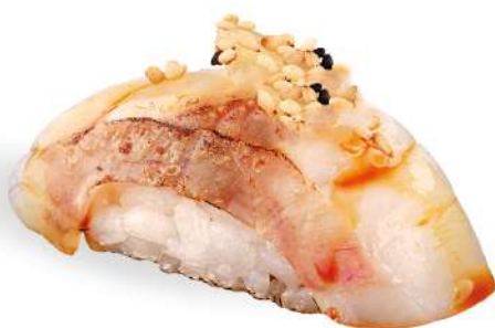
170 SUZUKI FIRE branzino* scottato con salsa teriyaki e sesamo