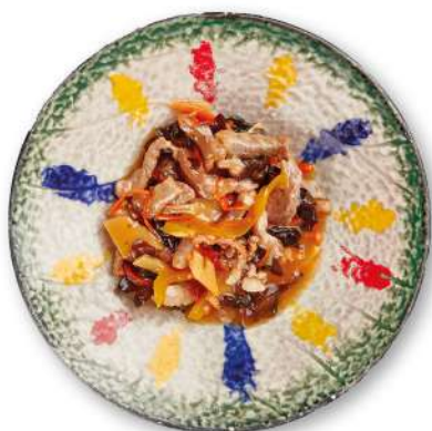
292 MAIALE PICCANTE maiale piccante con peperoni