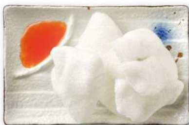
29 NUVOLE DI GAMBERI