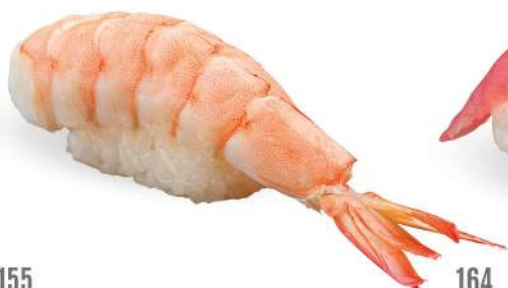
155 EBI gambero* cotto