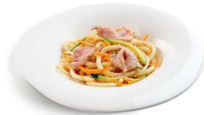
91 GYUUNIKU UDON spaghetti giapponesi con manzo, uova e verdure € 7,00