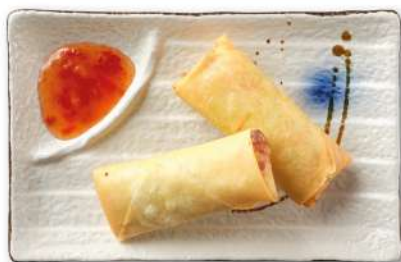
20 INVOLTINI DI VERDURE involtini ripieni di verdure