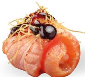
151 DUTOU SAKE tempura di salmone*, philadelphia, salsa teriyaki, kataifi*, salmone* scottato