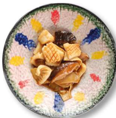
310 SEPIE CON BAMBÙ E FUNGHI sepie* con bambù e funghi