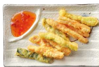
25 VERDURA FRITTA verdura mista fritta