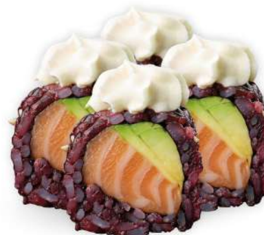
218 BLACK PHILADELPHIA riso venere, salmone*, philadelphia, avocado