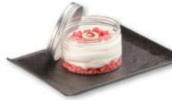
TROPICAL DELIGHT Semifreddo allo yogurt con crumble di biscotti e salsa al lampone. € 5.00