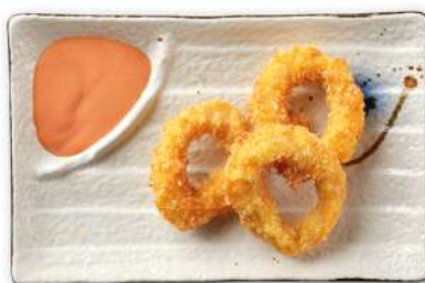
30 ANELLI DI CALAMARO anelli di calamaro* fritti