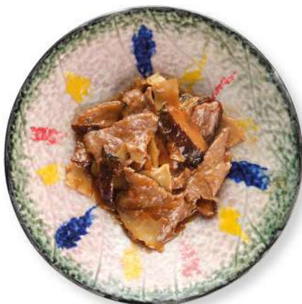
280 MANZO CON BAMBÙ E FUNGHI manzo con bambù e funghi € 8,00