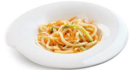
89 YASAI UDON spaghetti giapponesi con uova e verdure € 6,00