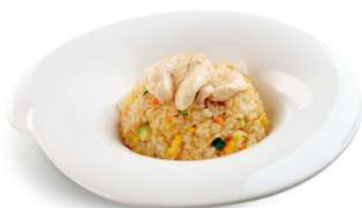
83 TORI MESHİ riso con pollo*, uova e verdure