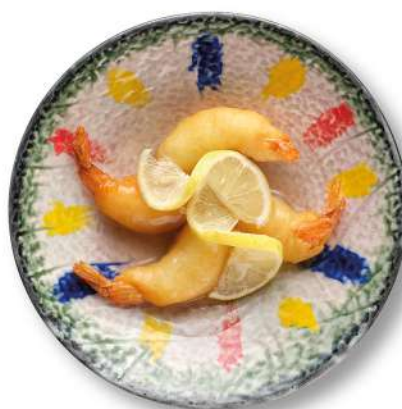
305 GAMBERI AL LIMONE gamberi* in pastella con salsa al limone