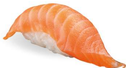
161 SAKE salmone*