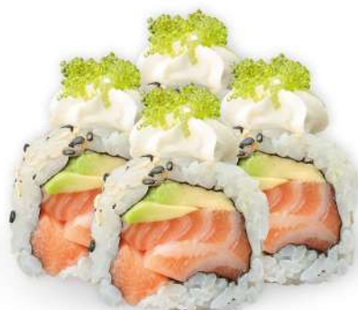
220 PHILADELPHIA salmone*, avocado, philadelphia, tobikko* € 5,00