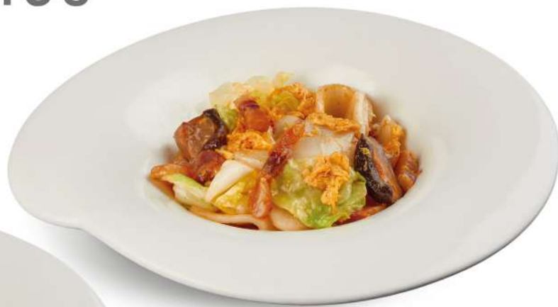
66 GNOCCHI DI RISO CON PANCETTA gnocchi di riso con cavolo cappuccio, pancetta cinese, funghi shiitake, uova € 6,00